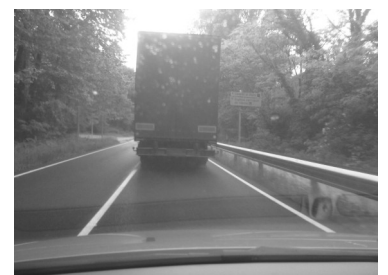
Un camió ocupa tot el carril i te tendència a trepitjar la contínua, per no apropar-se a la tanca