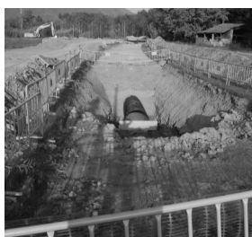
Obres de la canonada Pasteral— Montfullà, a plè ritme.

“Aquesta situació de crisi no pot ser una excusa per no fer res, sobretot veient que si que hi ha moltes coses que segueixen endavant. No podem seguir essent el vagó de cua ni ciutadans de tercera”