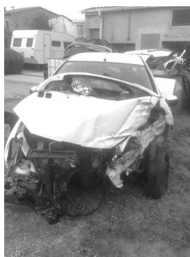
No estàs tip de trobar-te amb imatges com aquesta cada setmana?

Aquí ens juguem el nostre present i el nos-