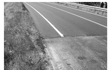
La línia pintada més endins que l'anterior. = menys carril.