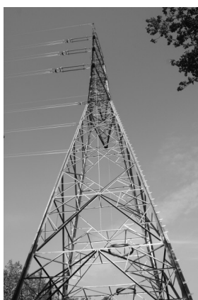
Les obres de la MAT tampoc s'aturen per la crisi.

“Aquesta situació de crisi no pot ser una excusa per no fer res, sobretot veient que si que hi ha moltes coses que segueixen endavant. No podem seguir essent el vagó de cua ni ciutadans de tercera”