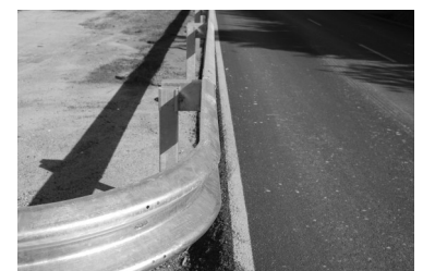
La tanca enganxada a la calçada